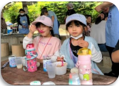
いつも仲良しのふたりひとり親家庭企画BBQに参加