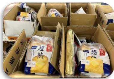
お米やレトルトのカレー、お菓자에パンなどを詰めたフードパック