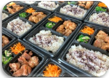
サポスク応援団お弁当