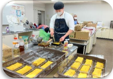
いただいた卵で大量の卵焼き作り